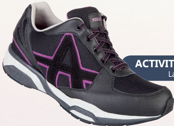
ACTIVITY DCS FEMME